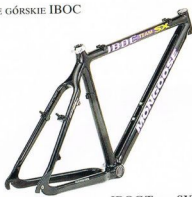
IBOC Team SX