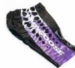
Spodenki kolarskie Mongoose Team