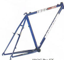
IBOC Pro SX