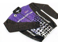
Bluza przeciwdeszczowa Mongoose Team