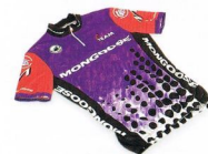
Koszulka kolarska Mongoose Team