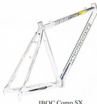
IBOC Comp SX