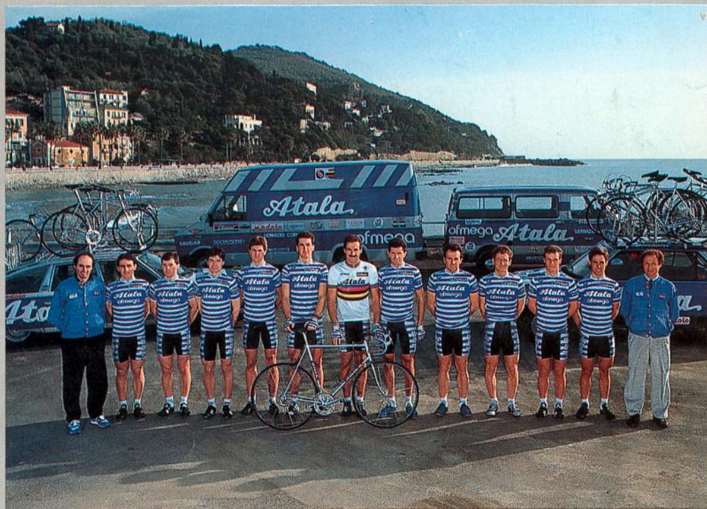
CAMPIONE D'ITALIA 1982-1983 - CAMPIONE DEL MONDO 1982 - 1983 - 1984 - 1985 - 1986